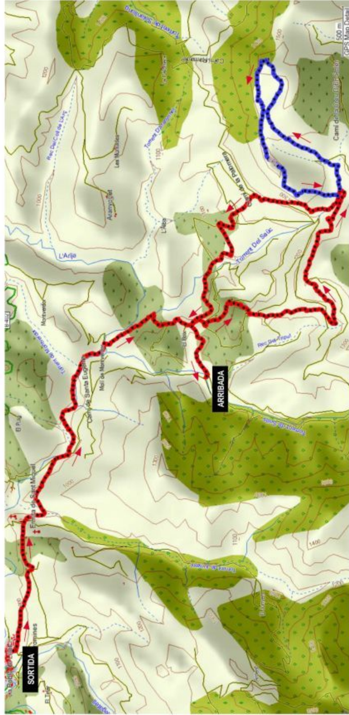
Caminada sencera i curta