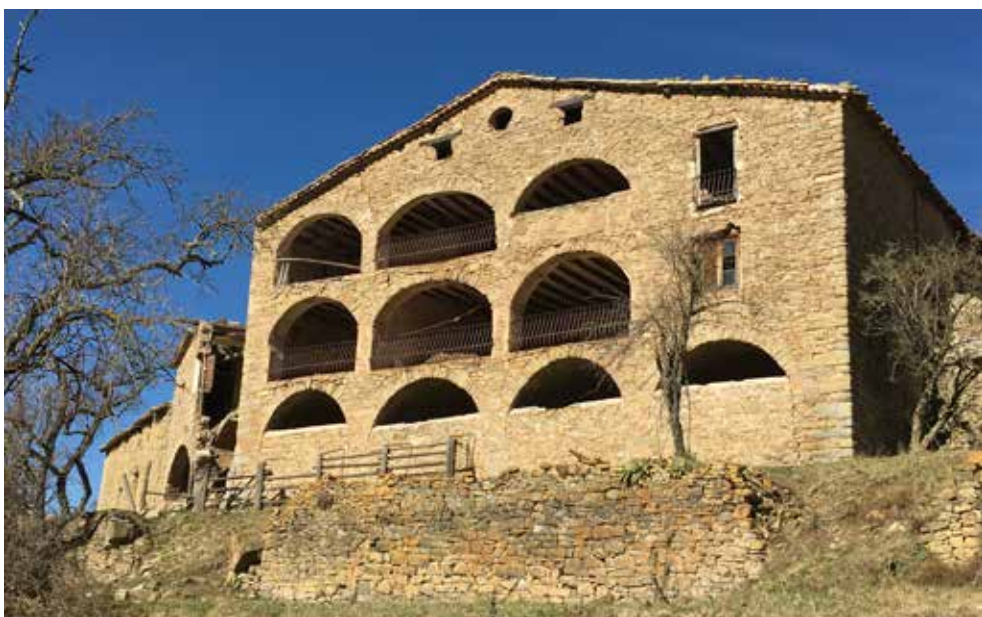
El Portell de l'Aranyonet.

Aproximació: En cotxes particulars fins el Pla de l'Arbre.